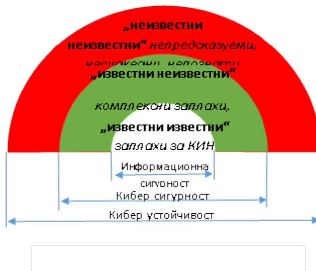
Фигура 1. Нива на познаване на заплахите и рисковете и нива на киберсигурността