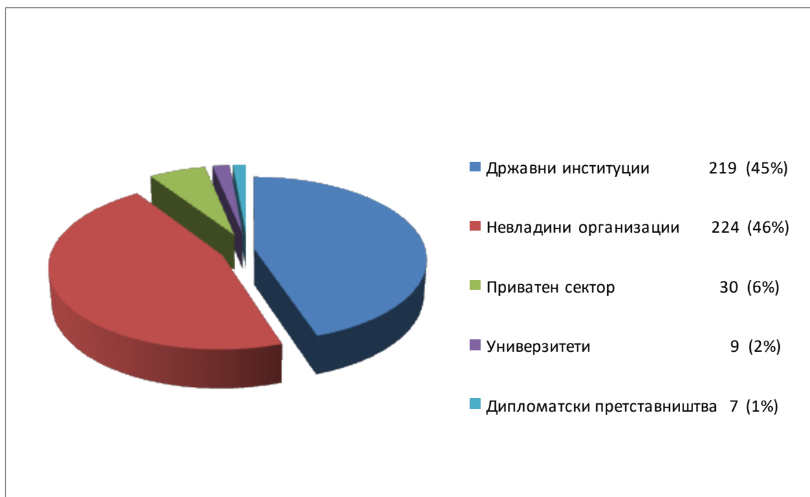
Приказ 2. Учесници на консултативни настани за ко - креација на предлог мерки

Во рамките на заложбите на Република Македонија за постигнување на Одржливите развојни цели како и прифаќањето на „Заедничката декларација за Отворена влада за спроведување на Агендата за одржлив развој до 2030“, во текот на подготовката на овој Акциски план Владата на Република Македонија се одлучи на пионерски напор за интегрирање на принципите за одржлив развој во Агендата за отворена влада.