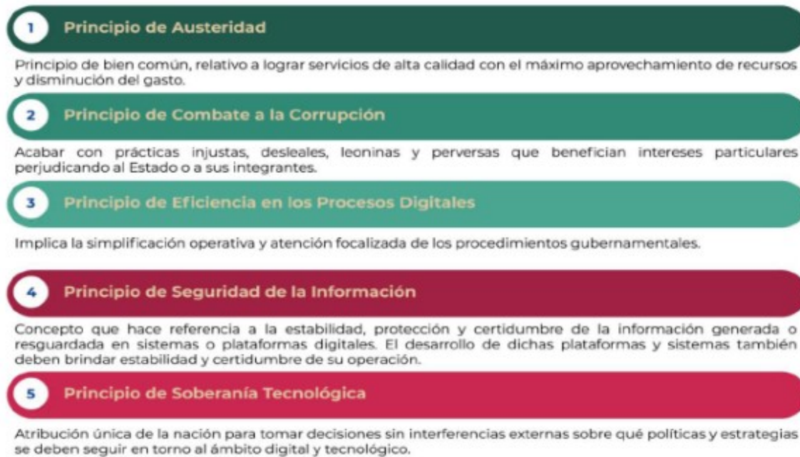
Figura 1. Principios de la EDN

Estos principios tienen sustento en una base humanista que privilegia el desarrollo técnico centrado en las personas; su seguridad ante usos o imposiciones tecnológicas arbitrarias; la transparencia de los códigos y algoritmos; el empleo de tecnologías robustas y fiables, su potencial libertario y beneficio social; sin restricciones a la libertad y la atención prioritaria de los grupos vulnerables.