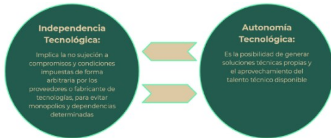
Figura 2. Visión de la EDN

Visión: Un país digitalizado y un gobierno austero, honesto y transparente, con autonomía e independencia tecnológicas, centrado en las necesidades ciudadanas, principalmente de los más pobres.