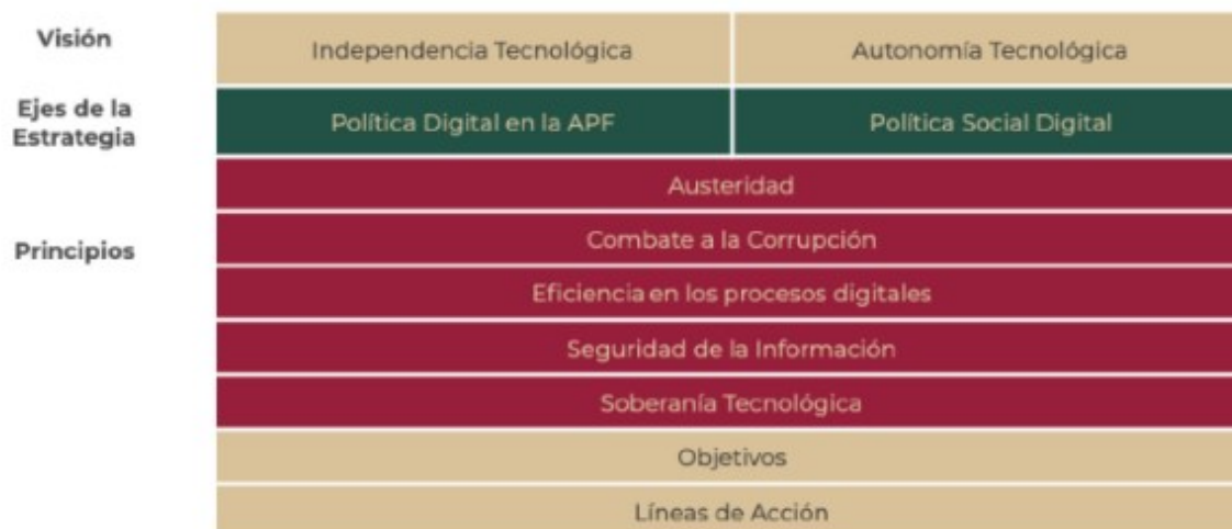
Figura 3. Marco estructural de la EDN

La siguiente figura esquematiza dicho marco estructural: